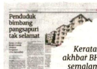
Keratan akhbar BH, semalam.

"Saya amat berharap kerajaan negeri memberi perhatian serius terhadap masalah ini kerana kejadian seumpama ini bukan